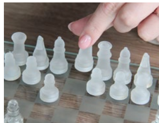
2 Tips voor de ondernemer in de inkomstenbelasting