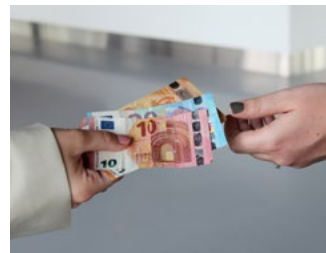
3 Tips voor de bv en de dga