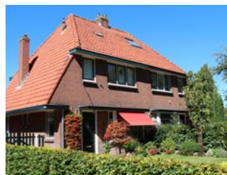
6 Tips voor de woningeigenaar