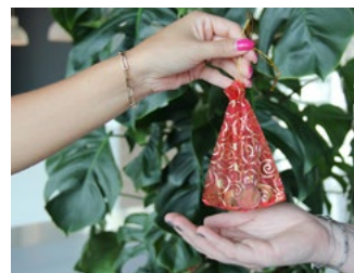
7 Tips inzake de btw