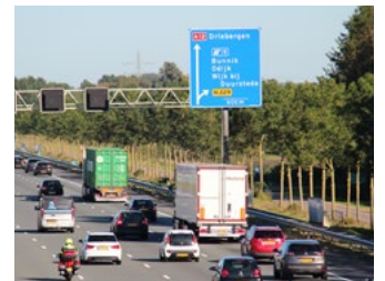
4 Tips voor werkgevers