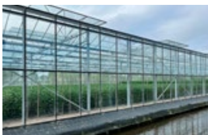
8 Verduurzaming en klimaat